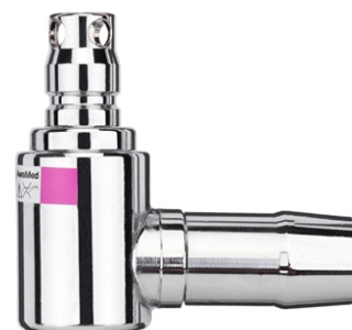
wtyk AGSS DIN 2 kątowny