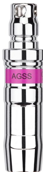
wtyk AGSS DIN 2 prosty