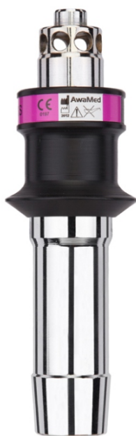
wtyk AGSS DIN 1