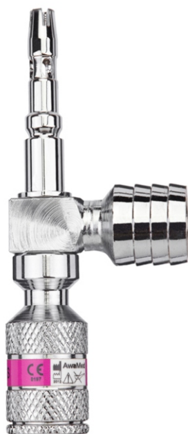
wtyk AGSS AGA